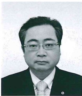
新見商工会議所青年部 平成26年度会長